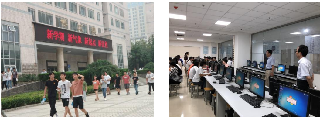
图1 学生第一天上课

从检查情况看，绝大多数教师高度重视第一堂课，提前到达教室，调试设备，使用手机数字课堂APP进行签到、考勤，无教师迟到现象发生。学生除极少数请假外，均能按时上课。整体教学运行状况良好，师生精神饱满，态度端正，教与学热情较高。