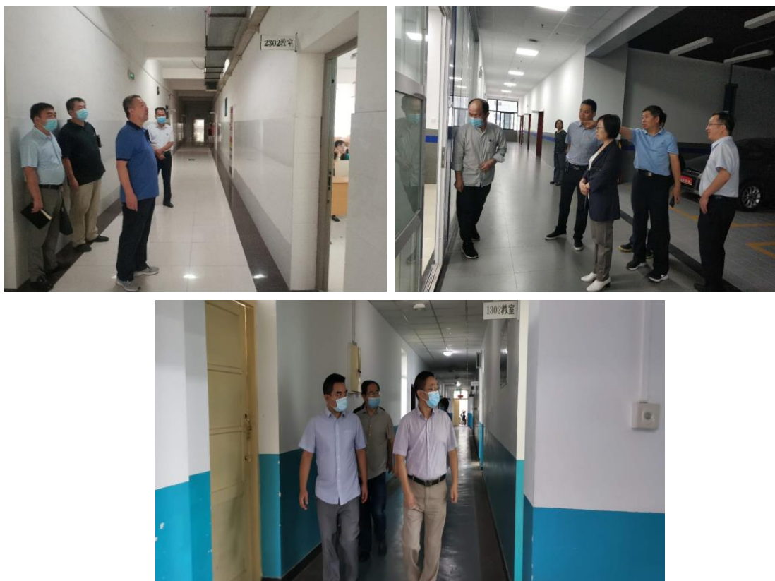
图1 校领导带队检查开学第一天上课情况

全校师生高度重视第一堂课，提前到达教室，消杀测温，调试设备，使用手机数字课堂APP进行签到、考勤，无教师迟到现象发生。除少数学生因身处疫区请假外，均能提前做好上课准备，按时上下课。整体教学运行状况良好，师生有秩序、分批次、分通道进入教学场地，展现了良好的精神风貌和教风学风。