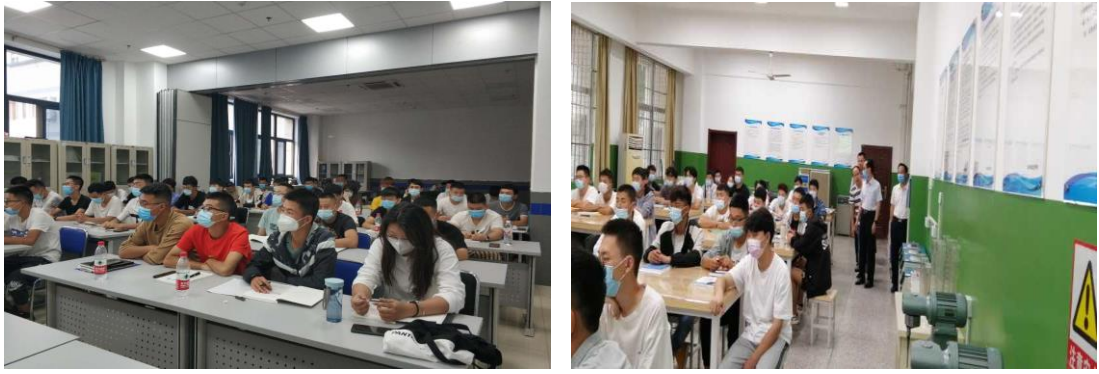
图 2 开学第一课秩序井然

开学第一天，数字课堂手机端运行正常，师生使用该 APP 签到，进行实时考勤。管理端数据监控显示，学生实时到课情况较好，第一天上午学生平均到课率 96%，详见图 3。