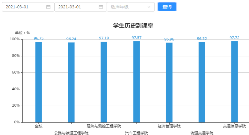
图 3 开学第一天学生到课情况截图

开学第一天，数字课堂手机端运行正常，师生使用该 APP 签到，进行实时考勤。管理端数据监控显示，学生实时到课情况较好，第一天学生平均到课率 96.75%，详见图 3。