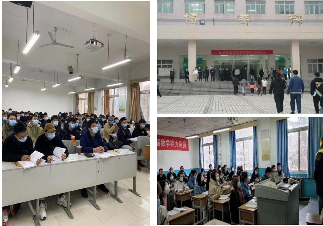
图 2 开学第一课秩序井然

开学第一天，数字课堂手机端运行正常，师生使用该 APP 签到，进行实时考勤。管理端数据监控显示，学生实时到课情况较好，第一天学生平均到课率 96.75%，详见图 3。