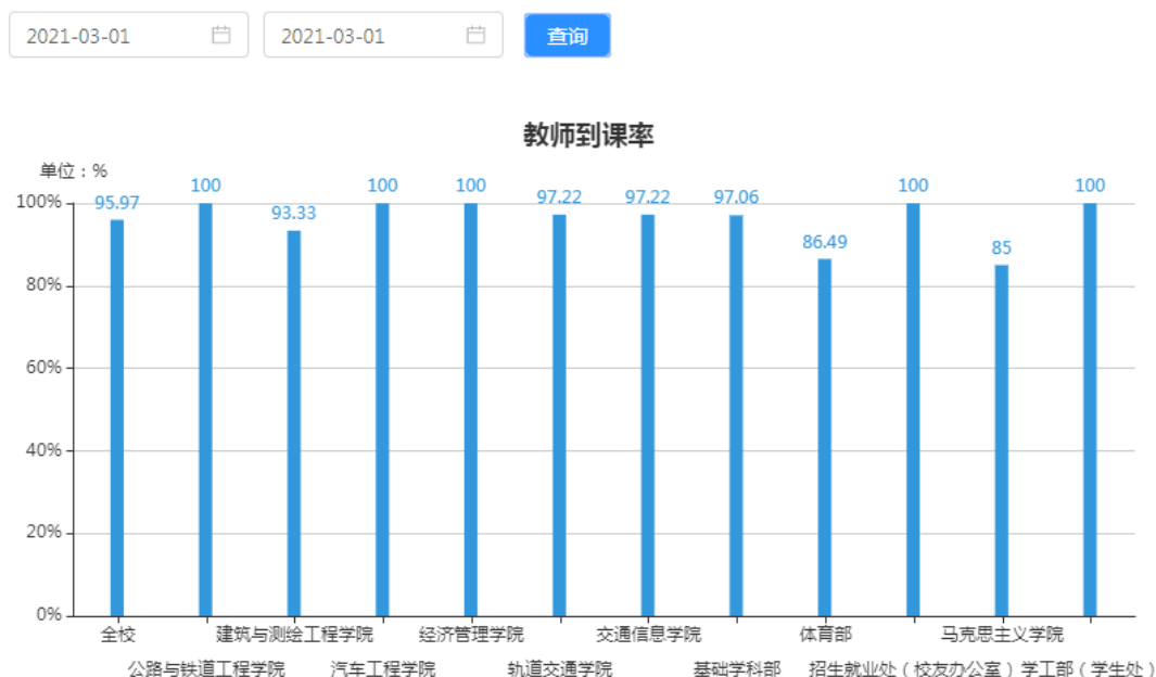
图 4 开学第一天教师签到情况截图

开学第一天，教师使用数字课堂签到情况见图 4，全校教师平均签到率 95.97%。请各开课部门督促教师每天使用平台进行签到，方便掌握课堂教学数据和全校课时工作量统计。